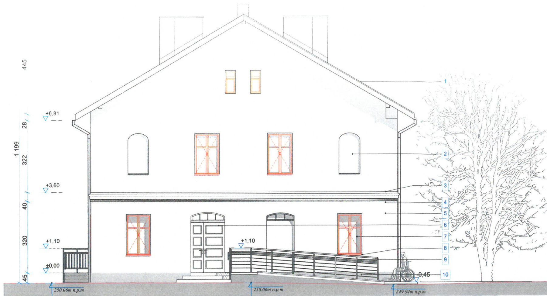
01 ELEVACJA ZACHODNIA RYS. NR 04 SKALA: 1:100 (A3)