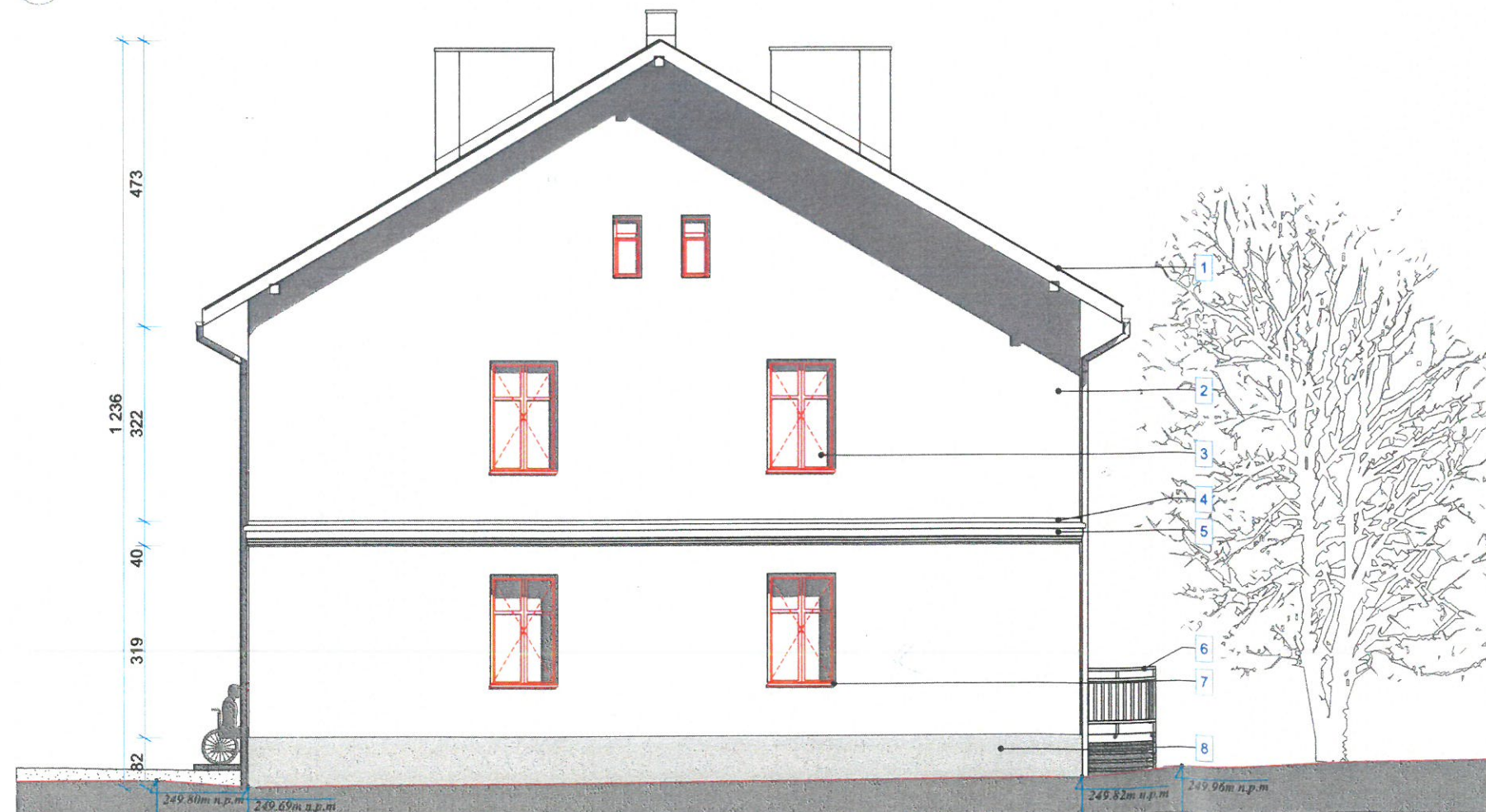
02 ELEVACJA WSCHODNIA RYS. NR 04 SKALA: 1:100 (A3)